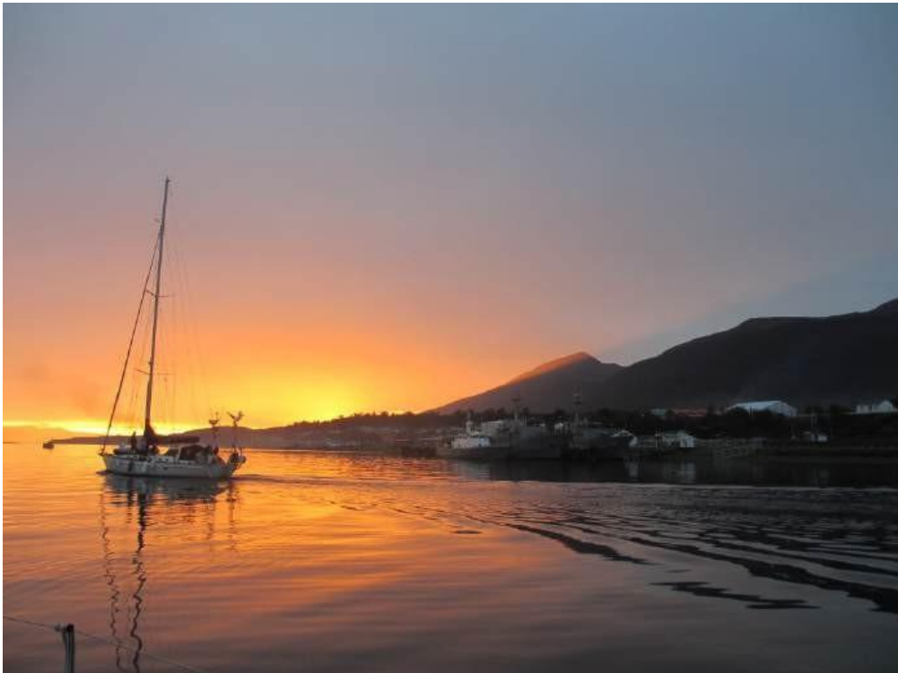
Vingt- neuvième jour, formalités de sortie du Chili à Puerto Williams